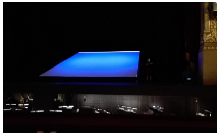
Ez a „ferde tó” A fából faragott királyfi egyetlen díszlete